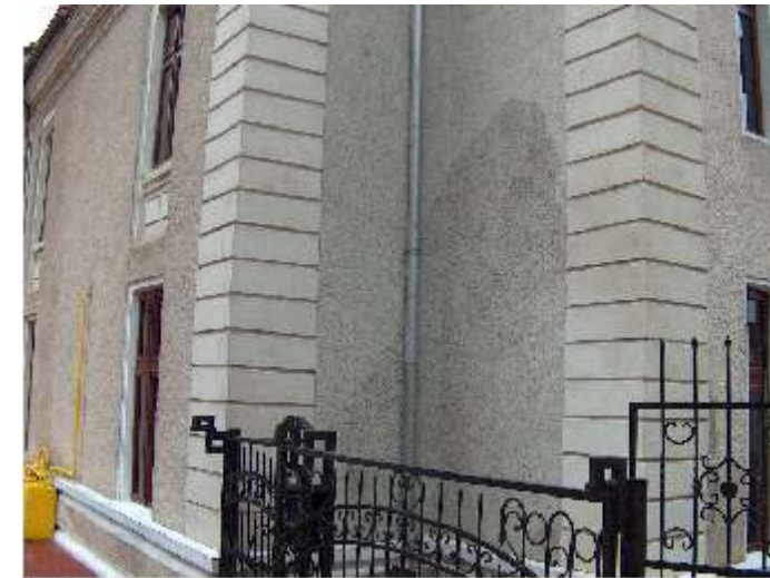
FATADA LATERALA STANGA